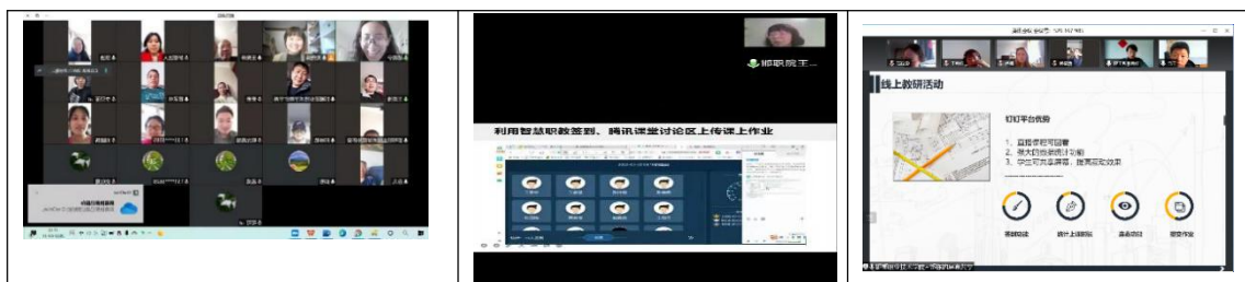
各教学单位教研活动线上会场